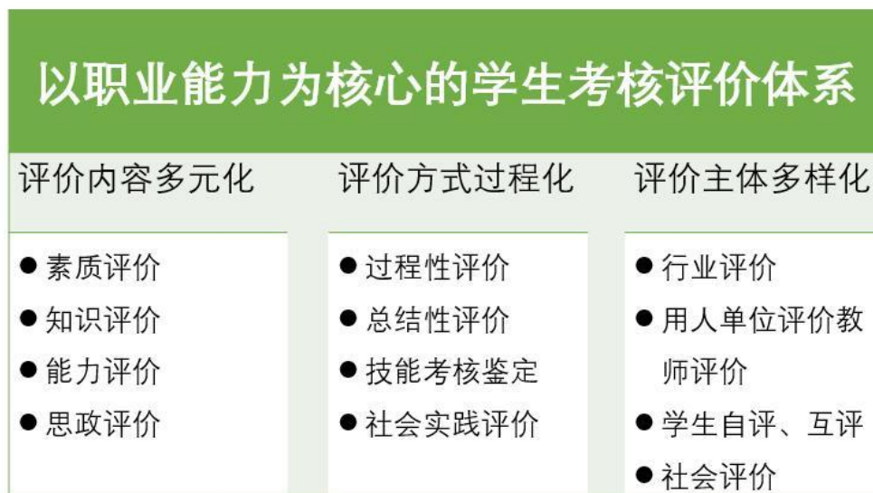
图 4 学生考核评价体系

教学实施后，评定学生的学习成绩，考核学生掌握知识、技能的程度和能力水平以及达到教学目标的程度。通过对毕业生的跟踪调查、就业单位意见反馈和社会评价，对专业标准的科学性、合理性、适应性和毕业生的质量以及教学组织的满意度进行考察，为修订新的专业标准和教学实施方案提供依据。